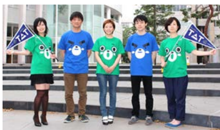
大人気の農工大公式キャラクター「ハッケン、コウケン」のキャラクターTシャツを着たスタッフが皆様をお待ちしています！