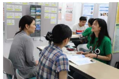
学生による相談コーナー (6月開催イベントでの様子)