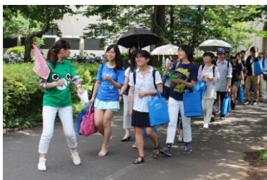
学生ガイドによるキャンパスツアー (6月開催イベントでの様子)